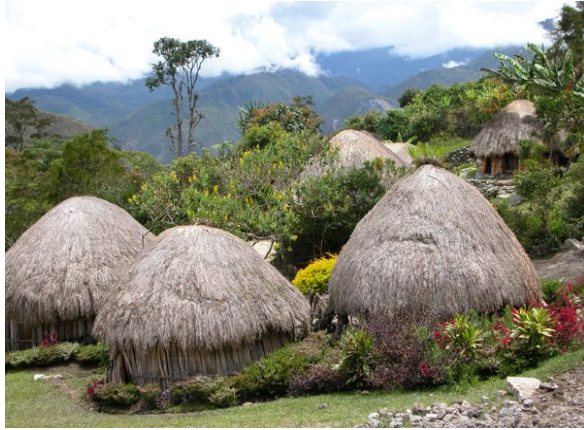
Rumah Adat Suku Dani