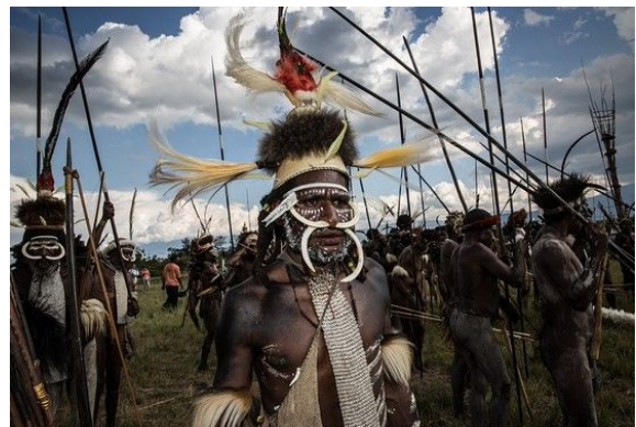
Masyarakat Suku Dani