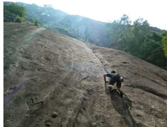
Aktifitas Panjat Tebing