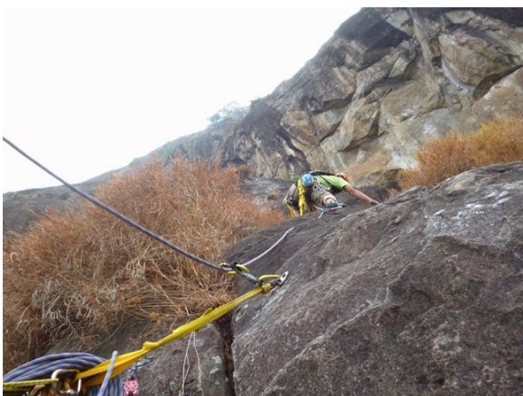
Aktifitas Panjat Tebing