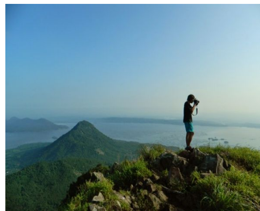
Puncak Gunung Parang