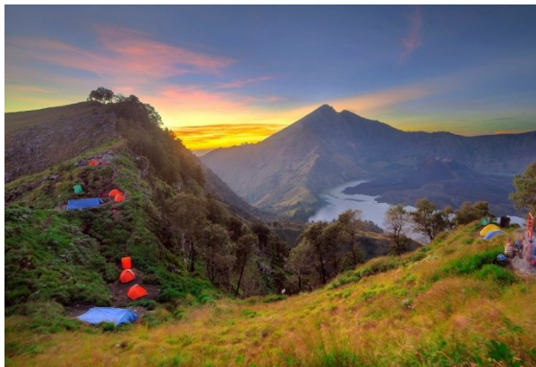
Plawangan Sembalun Creater