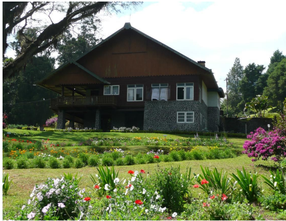
Desa Kawah Ijen