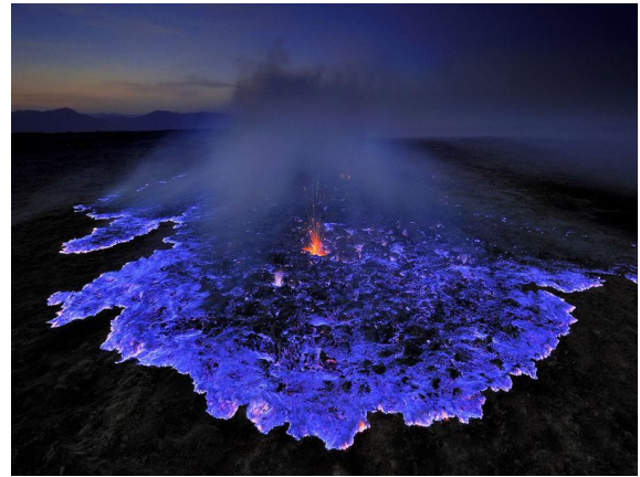
Api Biru Ijen