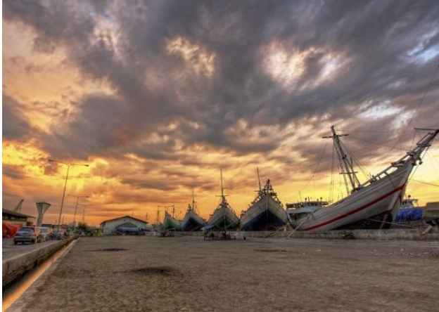
Pelabuhan Sunda Kelapa