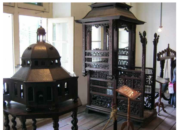
Koleksi Museum Fatahillah