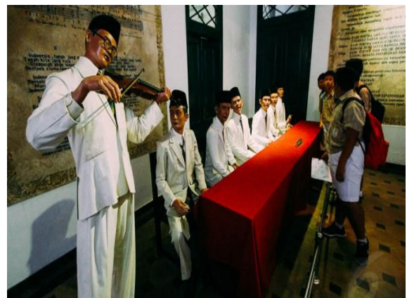
Museum Sumpah Pemuda