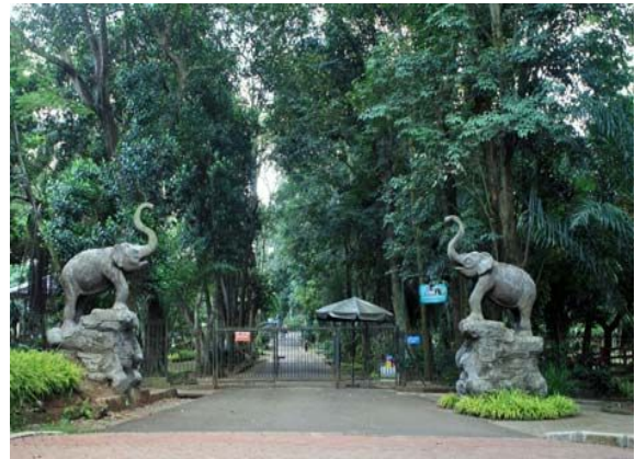
Taman Marga Satwa Ragunan