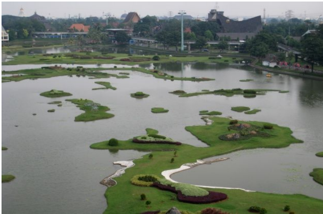
Taman Mini Indonesia Indah