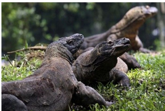
Kebun Binatang Ragunan