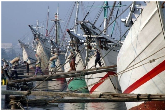
Pelabuhan Sunda Kelapa