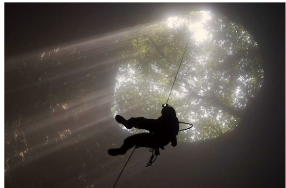
Aktifitas Menjelajahi Goa