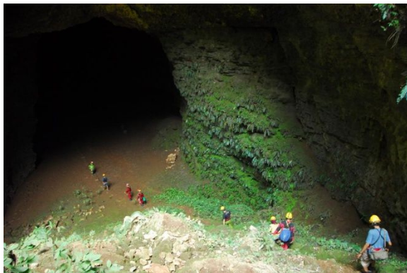
Aktifitas Menjelajahi Goa