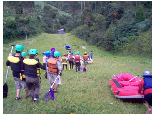
Menuju Sungai Palayengan