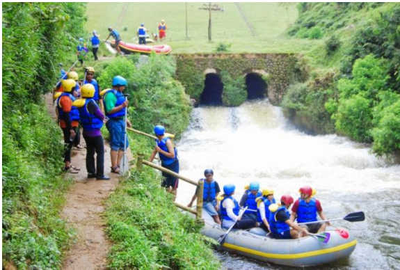
Aktifitas Arung Jeram