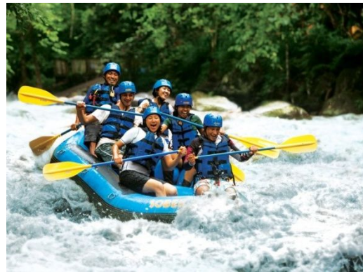
Aktifitas Arung Jeram