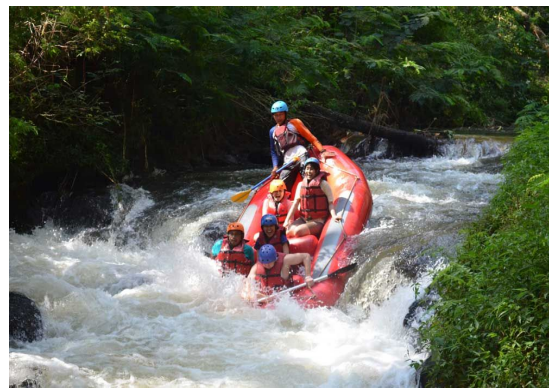
Aktifitas Arung Jeram