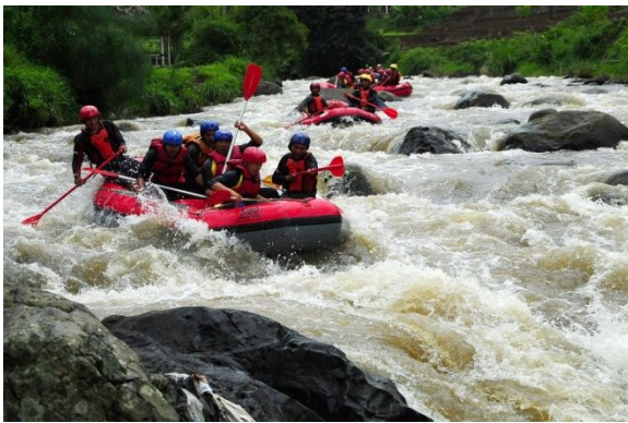
Aktifitas Arung Jeram