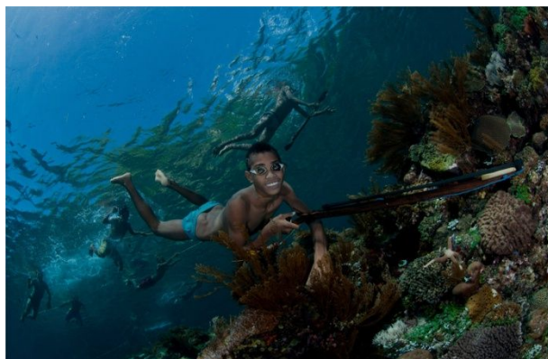
The Mini Wall