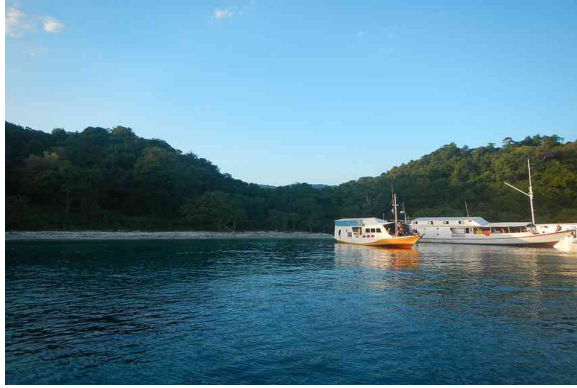
Pelabuhan Muara Kali