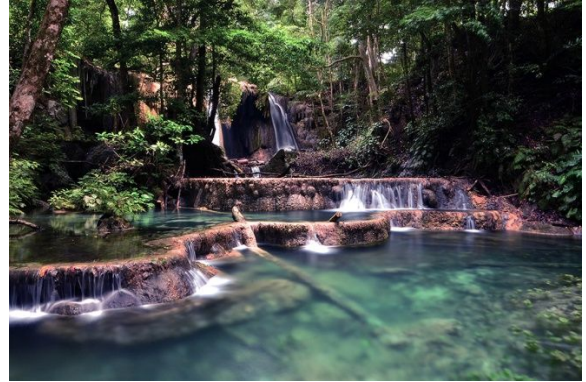
Air Terjun Mata Jitu