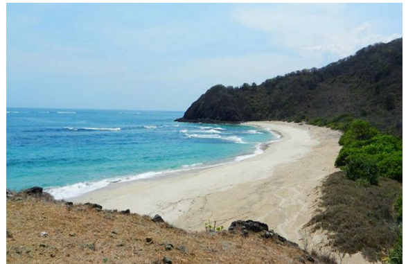
Pantai Ai Manis