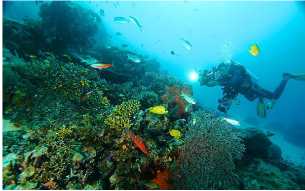
Taman Laut Raja Ampat