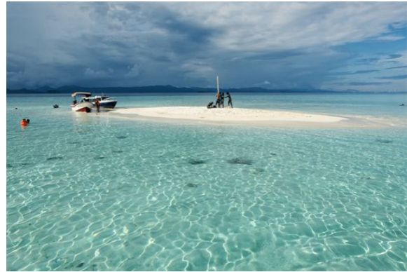
Pantai Pasir Timbul