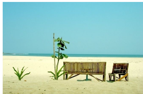
Pantai Pasir Putih