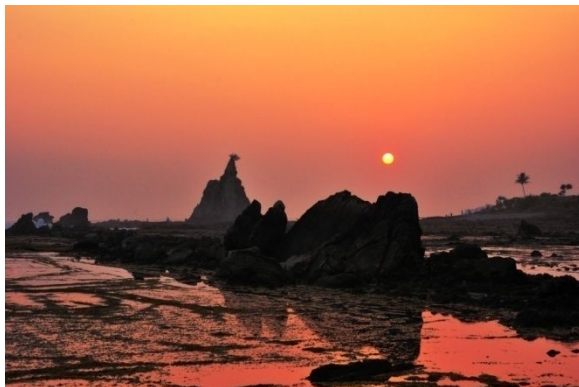
Pantai Tanjung Layar