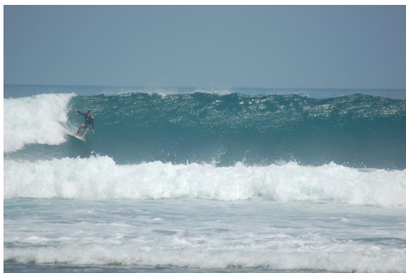
Sawarna Surf Point