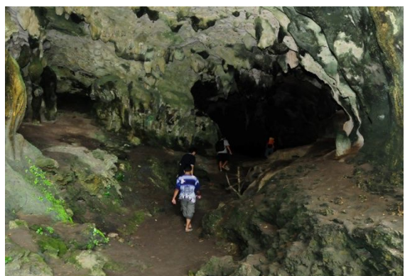
Aktifitas Menjelajahi Goa