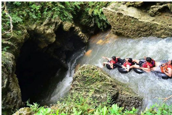
Aktifitas Menjelajahi Goa