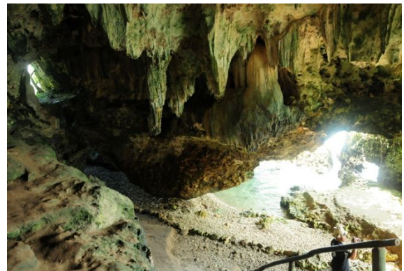
Aktifitas Menjelajahi Goa