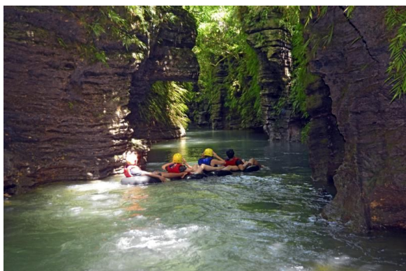
Aktifitas Menjelajahi Goa